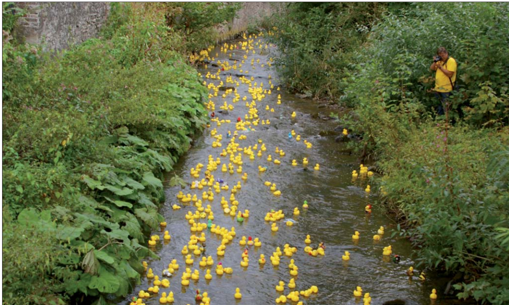
Beim Sayner Jubiläums-Entenrennen herrscht wieder Hochbetrieb auf dem Brexbach.

„Rennenten“ ab sofort in Bendorf sichern - Rennen am 5. September